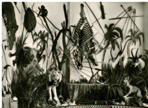
ultranature 1, 2010