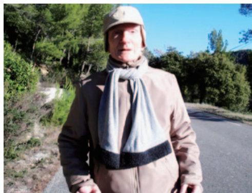
ultranature 3, 2011